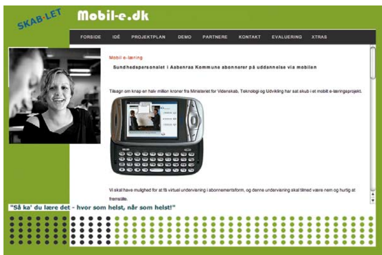
Mobil-e.dk från VUC, Sønderjylland.

skolenheter eller mellan en praktikplats och skolan. Genom s.k. kreativa mallar ska lärare utan specialkunskaper kunna skapa lärresorser som integrerar text, tal, ljud och video i interaktiva former för både handdatorer och vanliga datorer.